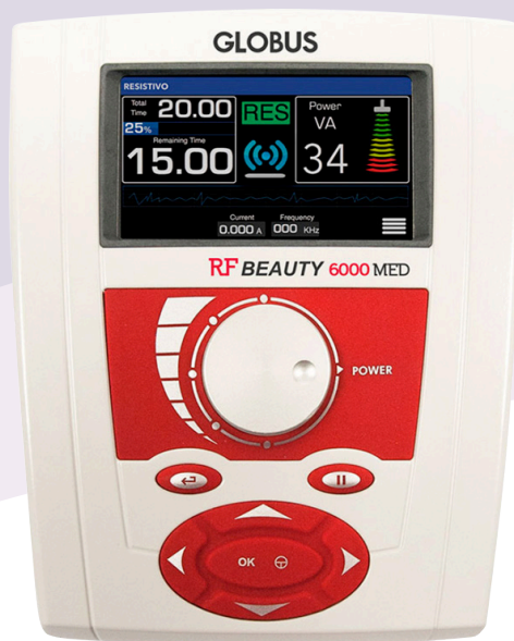
RF BEAUTY 6000 MED